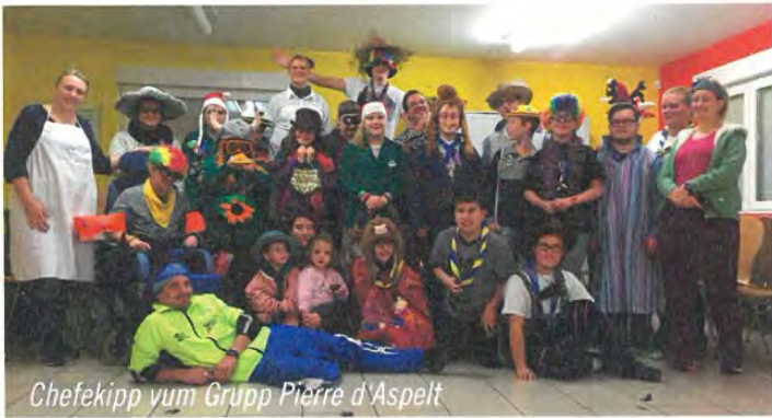
Chefekipp vum Grupp Pierre d'Aspelt

Mat e bëssen Uleedung ass et hinnen guer net esou schwéier gefall Spilliddeen unzepassen souwuel un déi kierperlech wéi och geeschteg Fäegkeete vun den Gamma-Scouten. Sou grouss sinn d'Ënnerscheeder fir Animatioune fir en Grupp validen Kanner an Jugendlecher zu den Gamma-Scouten guer net. Ganz viles wat eis benevole Animateuren schonn geléiert haten an aneren Aktivitéiten ausprobéiert hunn, konnt hei och agesat ginn.