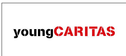
youngCaritas Schweiz youngcaritas.ch