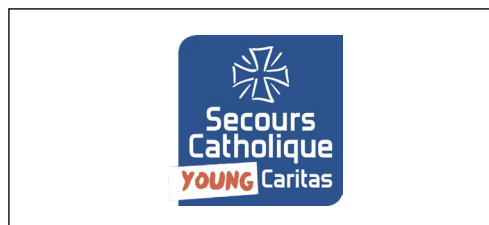
Young Caritas France secours-catholique.org/young-caritas