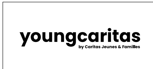
youngcaritas Luxemburg youngcaritas.lu